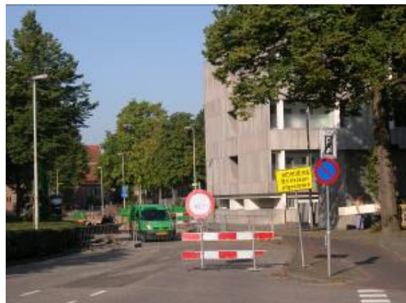
Gelukkig is dit weer achter de rug!

Buurtpreventievereniging Centrum Bussum blijft zich inzetten voor de belangen van de leden en laat het nodige van zich horen.