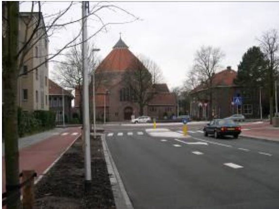
Nieuwe rotonde Brinklaan – Nieuwe Raadhuisstraat

Daaruit zal blijken hoe het verkeer zich ontwikkelt.