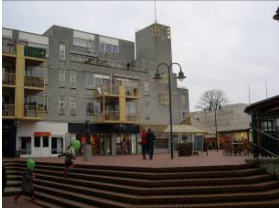
De Nieuwe Brink

De Gemeente zorgt voor uitgebreide informatie over nieuwe ontwikkelingen rond Scapino en de Nieuwe Brink. Wij zullen ook deelnemen aan de overleggroep over deze plannen, waarbij we de stem van onze leden laten doorklinken om knelpunten en oplossingen aan te dragen.