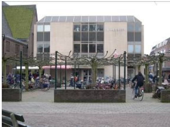
Fietsenstalling bij Bibliotheek wordt binnenkort bewaakt tijdens de markt en winkel piekuren

Wij zien uit naar de realisatie van de genoemde verbeteringen.