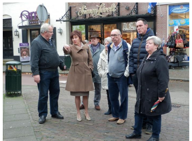
Bespreken fietsenoverlast rondom Albert Heijn

De geplande wijkschouw op de avond van 21 oktober jl. ging door drukke agenda's niet door.