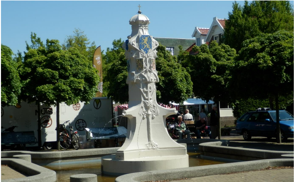
Zomer en najaar 2015 – De Wilhelminafontein met vies water is geen mooi visitekaartje .....