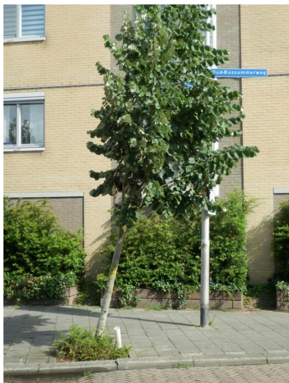
Gelukkig staan de bomen weer rechtop.

Binnen één dag zijn er nieuwe steunpalen aangebracht!