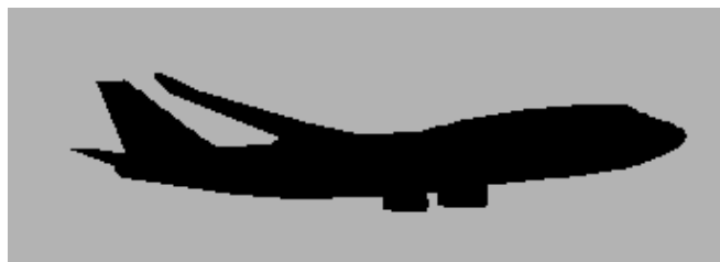
Meer vliegtuigen boven Bussum!

ZET DEZE NUMMERS DUS SNEL IN UW MOBIELTJE !!!