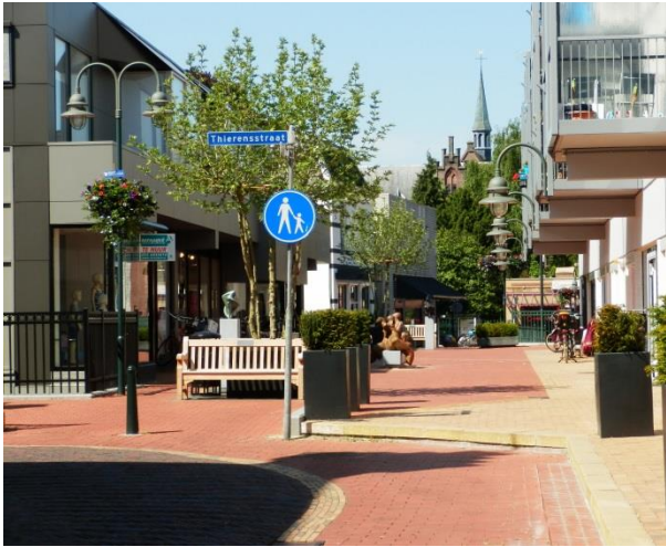
De Nieuwe Brink ziet er zo een stuk beter uit.

Nu nog meer winkelnering in de lege winkelpanden en gezellige terrassen in het zonnetje op het plein van de Nieuwe Brink.