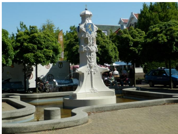
De Wilhelminafontein staat er weer fris opgeknapt bij

Eind augustus wordt de proef met het soberder onderhoud door de gemeente geëvalueerd. Wij zullen dan zeker van ons laten horen.