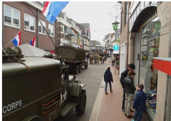
De jaarlijkse tocht van legervoertuigen in de Kapelstraat.

Wij horen graag uw bevindingen over de nieuwe aanpak!