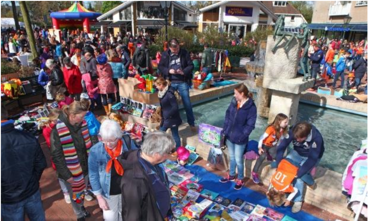
Koningsdag 2015 – Het was weer reuze druk in het centrum