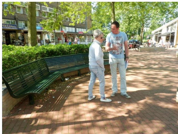
Discussie over zwerfvuil op straat

Van diverse leden ontvangen wij klachten over de toenemende vervuiling van de straten en pleinen in het centrum. De proef van de gemeente met een lager niveau van beheer laat helaas zijn sporen na.