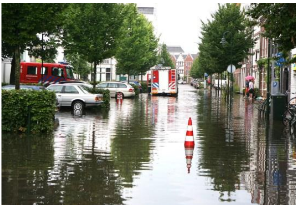
Straten stonden lang blank

Om te voorkomen dat bij wateroverlast de boel opnieuw onderloopt heeft de gemeente o.a. alle straatkolken laten reinigen.