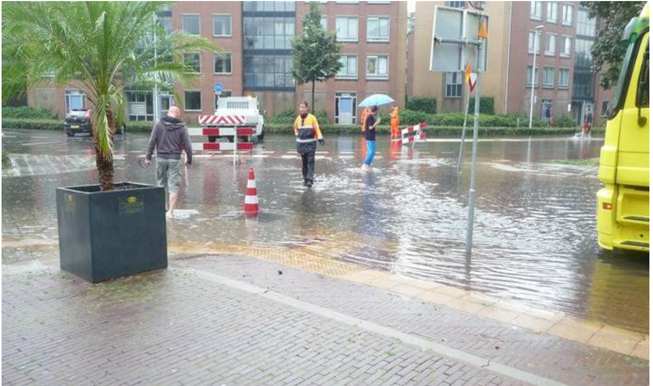
28 juli jl. flinke wateroverlast in het centrum