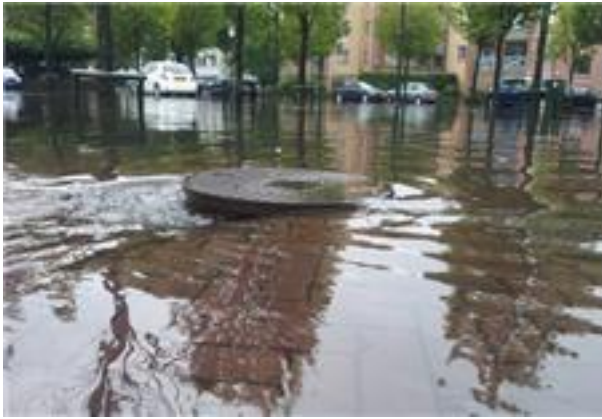
Kan de Bussumse riolering genoeg verwerken?