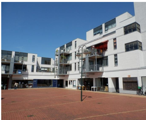
De Nieuwe Brink is een stuk opgeknapt door het frisse schilderwerk!

Het bestuur gaat hier verder in overleg met de gemeente en de wijkagent mee aan de slag. Wij zullen u er zo gauw mogelijk verder over informeren.