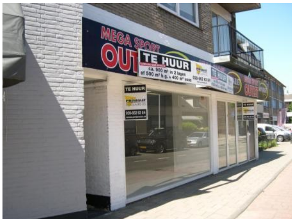
Landstraat: sport outlet is fitnesscentrum geworden

Leegstand heeft niet alleen gevolgen voor het centrum zelf, maar ook voor de leefbaarheid en de veiligheid van het centrum en de omgeving. Wij van onze BPV blijven daar op hameren.