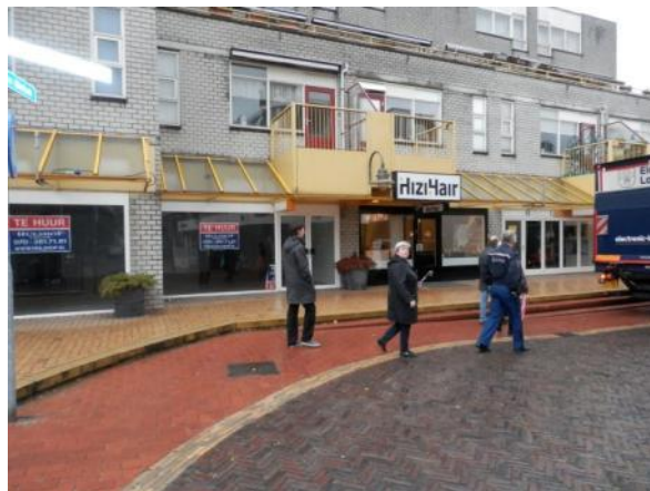
Nieuwe Brink: Desolaat winkelgebied

Eerdere kabelactiviteiten hebben veelal geleid tot verslechtering van het straatwerk en de trottoirs. De gemeente heeft aangegeven dat er namens hen voor de controle op de uitvoering van de glasvezelbekabeling een speciale toezichthouder is aangewezen.