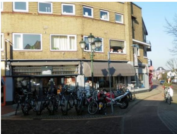
Weesfietsen en geblokkeerde doorloop voor voetgangers op de hoek Havenstraat/Landstraat

Het bestuur van onze BPV zal zich over deze punten in de eerstkomende vergadering beraden.