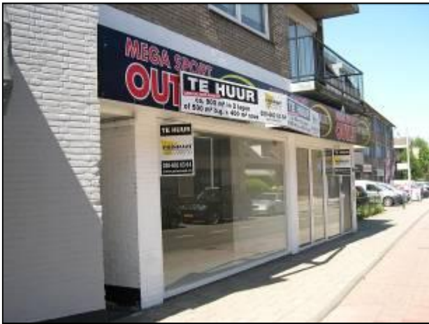
Steeds weer andere te huur staande winkelpanden.