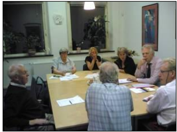
Het eerste overleg tussen B.O.V. en BPV. in 2009

Eerste wapenfeit zal een wijkscouw van de B.O.V. gezamenlijk met onze BPV worden.