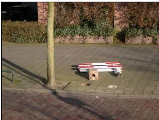
Vernielingen in de nachten in het weekend .....

De herrie is wel minder, maar erg verspreid. Vechtpartijen, vandalisme, etc. lijken zich te verplaatsen naar de gebieden zonder mobiele portiers.