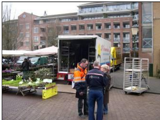
Overleg tijdens de wijkschouw op 23 februari jl.

Ook kunt u klachten bij de Servicelijn van de gemeente Bussum en/of de politie Gooi en Vechtstreek melden. (Zie bijgevoegd colofon)