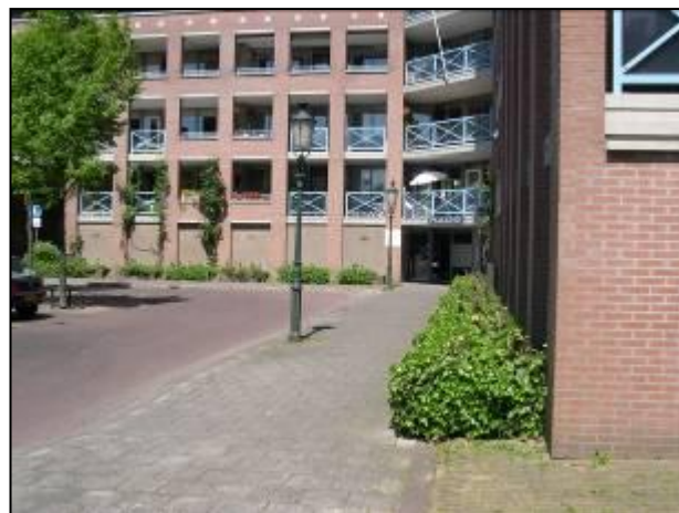
De vuurdoorns bij het Palladio zijn stuk gevoren en ondertussen afgezaagd.

Het plantseizoen is nu echter voorbij, maar er zullen zo spoedig mogelijk nieuwe geplant worden.