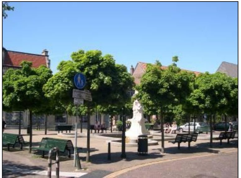
De Wilhelminafontein: Heerlijk rustpunt in het centrum

U kunt ook over uw ervaringen contact opnemen met de buurtcoördinatoren of via email naar info@bpvcentrumbussum.nl