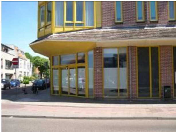
SNS-bank na het verwijderen van de pinautomaat geheel gesloten