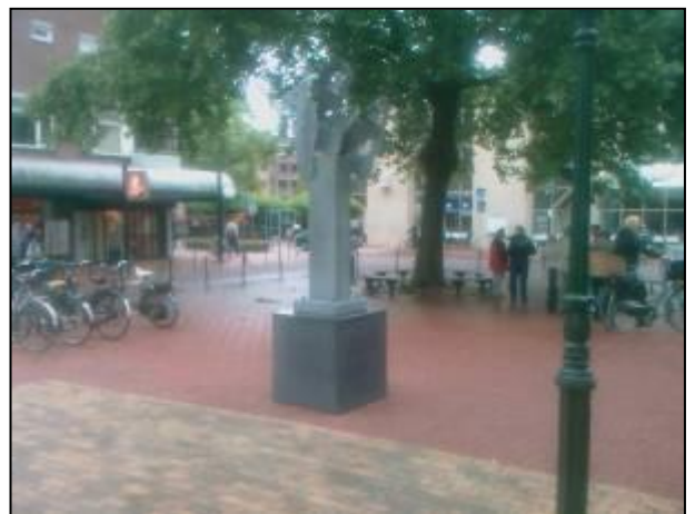
Kunstuiting op het Veerplein

U kunt daarvoor contact opnemen met de buurtcoördinatoren of via email naar info@bpvcentrumbussum.nl