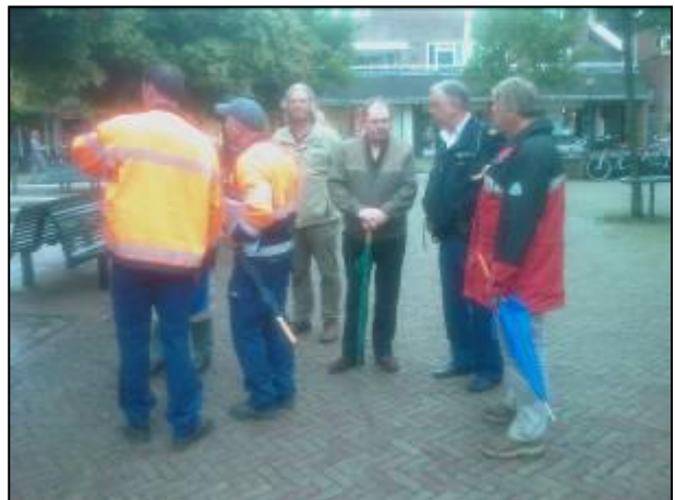
De wijkschouw op het Wilhelminaplantsoen

We hebben de staat slechte staat van de oude kastanjes op de Oud Bussummerweg aangekaart en vernomen dat daarbij de bloederziekte is geconstateerd. In onze volgende nieuwsbrief komen wij hierop terug.