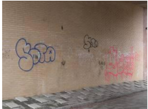
Toename van graffiti .....