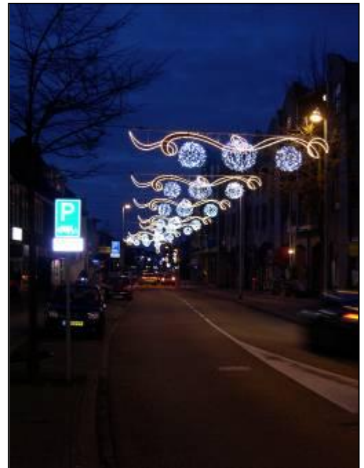
Mooie Kerstverlichting verzorgd door de BOV (de Bussumse Ondernemers Vereniging)

Wij behartigen uw belangen dus zo breed mogelijk en laten het nodige van zich ons horen. Daarbij is ook uw inbreng van groot belang . Geef ons informatie over uw ervaringen in uw omgeving! U kunt daarvoor contact opnemen met de buurtcoördinatoren of via email naar info@bpvcentrum.nl