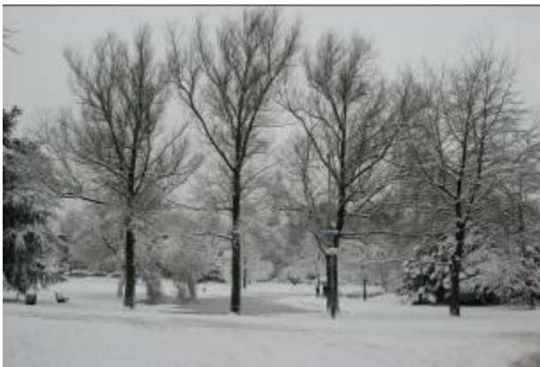
Ondanks de overlast toch een prachtig plaatje (de kom van Biegel)

We hebben onze grote waardering uitgesproken voor de grote inzet bij de gladheidbestrijding. Door alle sneeuw en ijs had wijkbeheer al snel te maken met schaarste van strooizout.