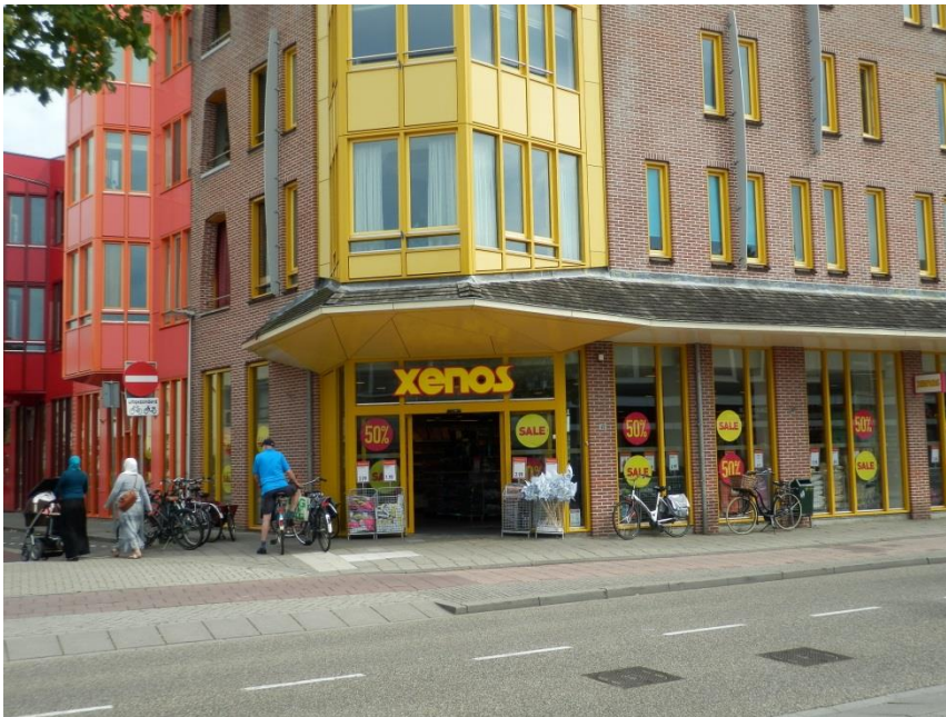
De SNS bank werd Xenos, dat werkte averechts op de winkelleegstand en zorgde voor excessen met gestalde fietsen.

Gelukkig constateren we de laatste tijd weer aan afname van de winkelleegstand door nieuwe winkels en eethuizen.