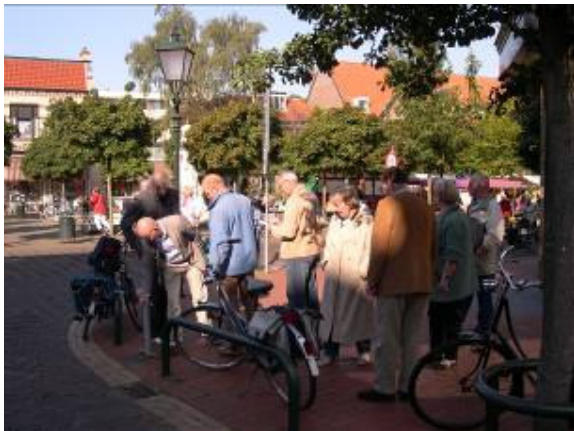
Wijkschouw ter plaatse van de Havenstraat