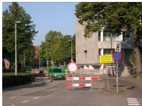
Volledige afsluiting, helaas ook voor de bus

Het grootste deel van de Brinklaan vanaf Naarden tot aan de Eslaan is gereconstrueerd. Sinds 25 augustus jl. ligt het kruispunt van de Brinklaan met de Nieuwe Raadhuisstraat open en wordt er gewerkt aan vervanging van de riolering en het vervolgens aanleggen van de rotonde. Ook wordt het gedeelte van de Nieuwe Raadhuisstraat van de Brinklaan tot de De Genestetlaan aangepakt.