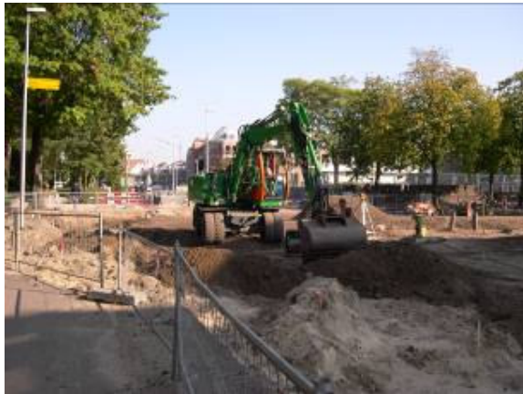
Werken aan de rotonde

Het één is wel mogelijk, maar het andere niet.