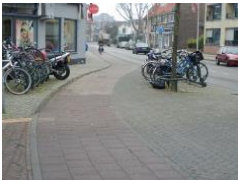
en in de Landstraat

Helaas is dat nog niet gebeurd bij Xenos waar ook veel fietsenoverlast is.