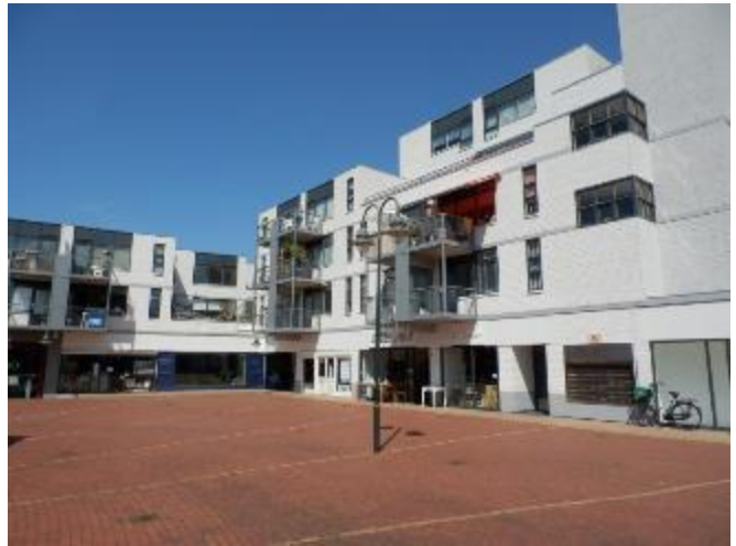
Mooi opgefrist, maar helaas nog steeds erg stilletjes.

Meldt u aan via www.burgernet.nl of installeer de App.