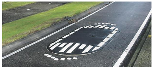
Proef met drempels