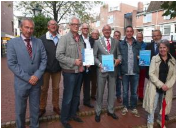
Derde ster KVO

Gelukkig heeft de gemeente vrij kort daarna het aantal fietsenrekken uitgebreid.