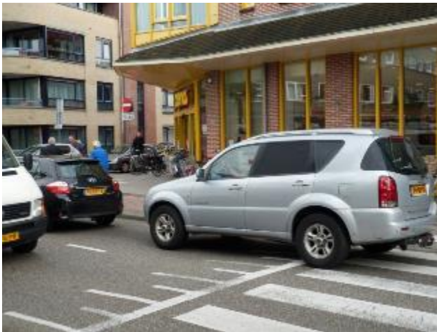
Oversteekbaar, maar met de nodige risico's

Wij verwachten dat dit voorjaar weer overleg wordt opgestart.