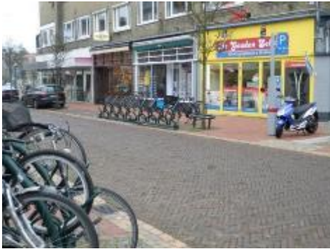
Nieuwe fietsenrekken in de Havenstraat ....