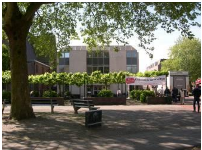
De succesvolle fietsenstalling bij de bibliotheek