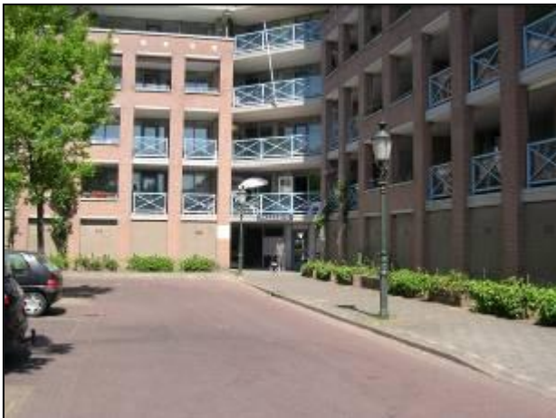
De vuurdoorns bij het Palladio hebben zich na het afzagen van de dode struiken hersteld.

De vuurdoorns bij Palladio die door de afgelopen strenge winter doodgevroren leken te zijn, hebben zich toch nog hersteld. Het dode hout zal dit najaar verder worden verwijderd en er zullen nieuwe vuurdoorns worden bij geplant.