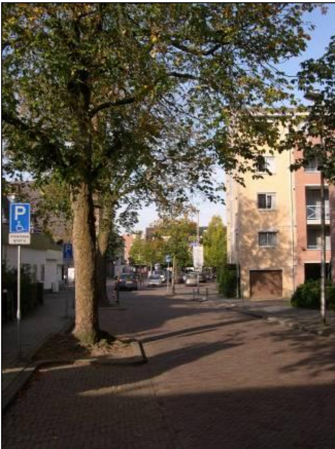
De kastanjes in de Oud Bussummerweg zijn dermate slecht, dat het kappen op korte termijn noodzakelijk is.

Opnieuw is ook de slechte staat van de oude kastanjes op de Oud Bussummerweg aangekaart. De bomen stonden er afgelopen zomer nl. al slecht bij met klein en betrekkelijk weinig blad. De bomen zijn aangetast door de bloederziekte. In december jl. is geconstateerd dat in twee kastanjes paddestoelen op stam en takken zitten. De gemeente laat de bomen zo lang mogelijk staan. De kastanjes met paddestoelen vormen een gevaar en zullen helaas op korte termijn gekapt moeten worden. Er zullen nieuwe kastanjes geplant worden.