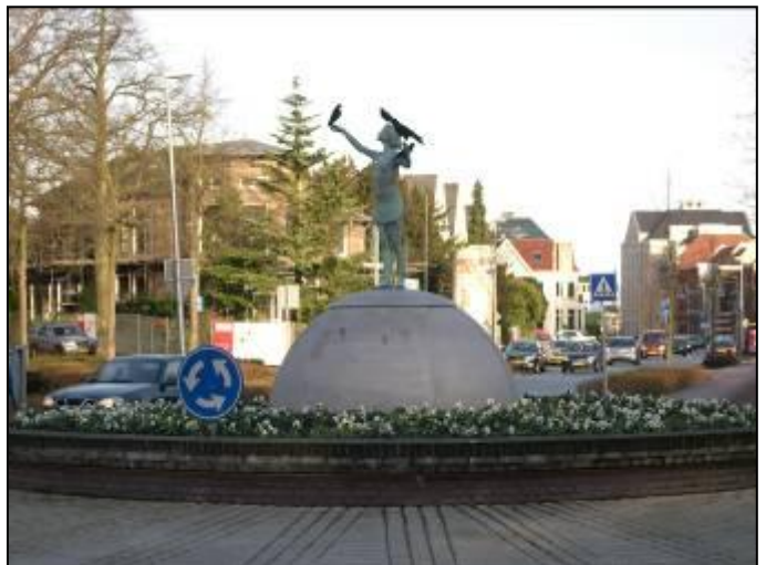
Een verrijking voor het centrum, maar helaas erg kwetsbaar voor vandalisme

U kunt over uw ervaringen contact opnemen met de buurtcoördinatoren of via email naar info@bpvcentrumbussum.nl