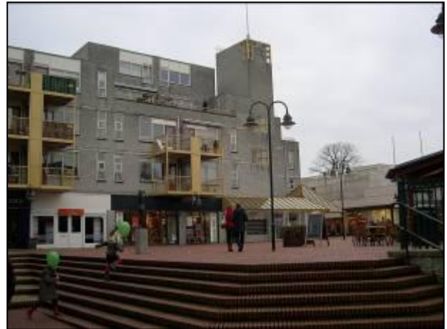
Leegstand o.a. op de Nieuwe Brink

De gemeente heeft medio augustus jl. een gebiedsvisie voor het centrumgebied voor 2030 opgesteld. Een samenhangende visie voor het centrum is uiterst belangrijk. De visie heeft, zoals is gebleken, een hoog ambitie niveau. In de huidige recessie met een winkelleegstand van 1 op 6 zullen de ambitieuze plannen moeilijk te realiseren zijn. De insteek van de gemeente is gericht op winkelen, uitgaan en verblijven in het centrum.