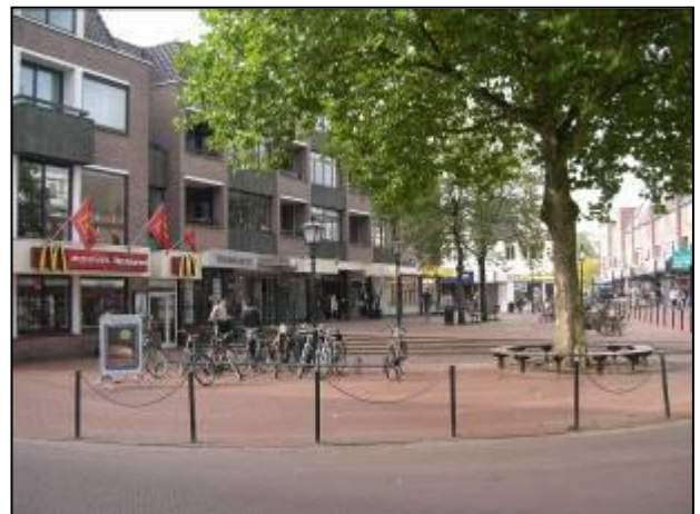
Mc Donalds aan het Veerplein

Mc Donalds had bij de gemeente een verzoek ingediend om in het weekend tot 2 uur open te kunnen blijven. De gemeente heeft gelukkig omwonenden geraadpleegd. Zij hebben de voordurende overlast van hangjongeren opnieuw onder de aandacht gebracht. Door de gemeente en de politie werd de overlast onderschreven. Mede vanwege de doelstellingen van het horecaconvenant en de flexibele sluitingstijden voor de horeca is besloten de sluitingstijden voor Mc Donalds niet tot 2 uur toe te staan. Omwonenden zijn hier erg blij mee.