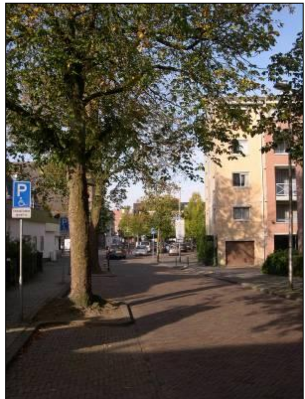
De kastanjes in de Oud Bussummerweg staan er helaas slecht bij

Bij de wijkschouw van 13 juli jl. hadden we slechte staat van de oude kastanjes op de Oud Bussummerweg aangekaart. De bomen staan er de hele zomer nl. al slecht bij met klein en betrekkelijk weinig blad. Wij vernamen toen, dat bij deze kastanjes de bloederziekte is geconstateerd. De gemeente laat de bomen zo lang mogelijk staan. Als de staat van de bomen uiteindelijk onaanvaardbaar wordt of gevaar gaat opleveren, dan gaat men over tot kappen. De gemeente zal dan opnieuw kastanjes plaatsen. Er wordt dan gekozen voor een kastanjesoort die minder gevoelig is voor de bloederziekte.