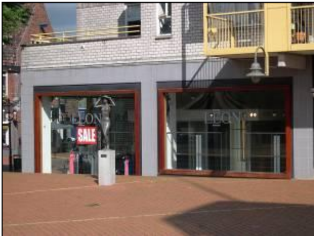
Leegstand door faillissement

Zoals u wellicht ook is opgevallen staan er veel winkels in het centrum leeg. Enerzijds is de recessie daar de oorzaak van. Anderzijds wordt er ook veel via internet gekocht. Winkels raken leeg door een faillissement of nieuwe cq verbouwde panden raken niet verhuurd.