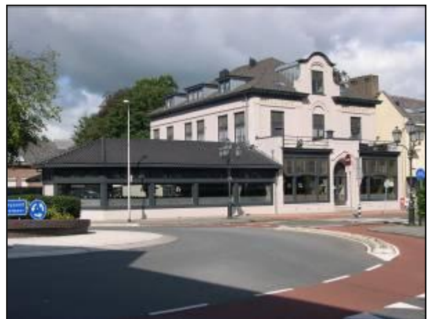
Bel ami, voorheen de Rozenboom, is een verrijking voor het centrum