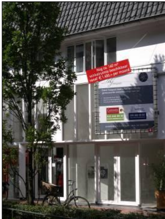
Niet te verhuren verbouwde panden