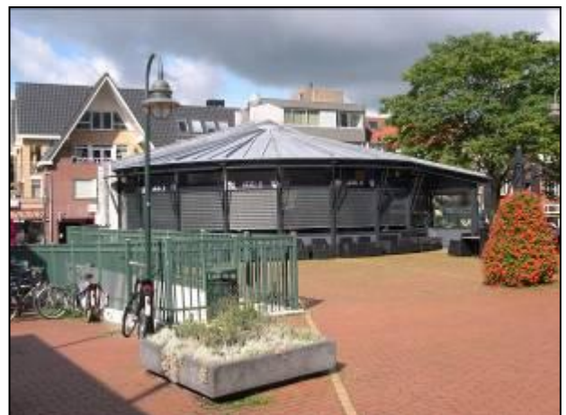
Op de Nieuwe Brink is restaurant Izzi gestart

Het centrum is verrijkt met 2 nieuwe restaurants. De Rozenboom is prachtig gerenoveerd en biedt als restaurant Bel ami een prettig vertoeven. Op de Nieuwe Brink is restaurant Izzi gestart.