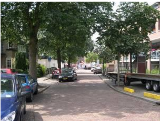
De Oud Bussummerweg kent veel nachtelijke overlast van horecabezoekers

Helaas blijkt de laatste tijd de overlast weer toe te nemen. Vooral rondom The Spot aan het Wilhelminaplantsoen, maar ook bij 't Raedthuys aan de Landstraat is er sprake van overlast. We hebben deze klachten bij de gemeente neergelegd en verwachten adequaat optreden.