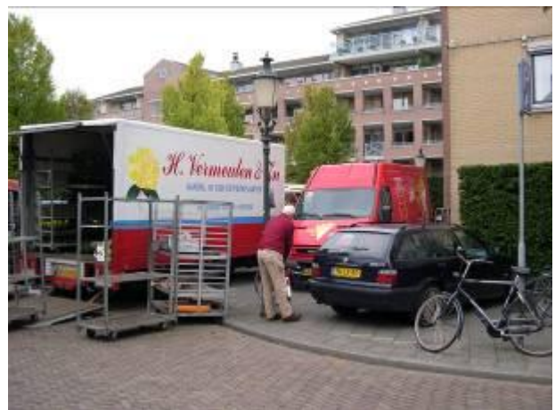
Rondom de markt blijft het rommelig

Wij kunnen u dan op snelle wijze informeren als er zich belangrijke zaken in onze woonomgeving voordoen.