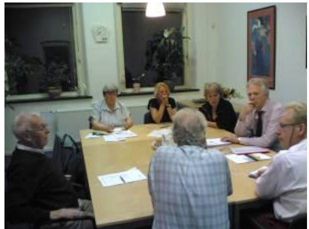
Overleg met de BOV bij Versa

Over onze activiteiten leest u in deze nieuwsbrief meer.