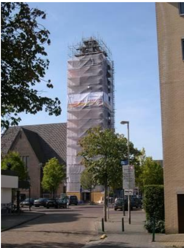
De Wilhelminakerk tijdens de werkzaamheden (sept. 2009)

Er bleek onduidelijkheid te zijn over de taakverdeling bij het toezicht op straat. De horecaondernemers verwachten meer toezicht van de Politie en de Politie meer handelend optreden van de horeca portiers. Burgemeester Schoenmakers heeft toegezegd dat op korte termijn duidelijke afspraken zullen worden gemaakt.