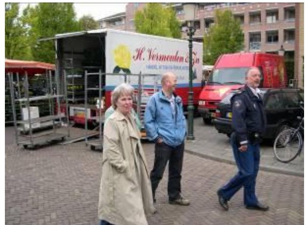
Er wordt aan een minder rommelige markt gewerkt

Dit overleg is constructief verlopen. Het overleg wordt twee keer per jaar gehouden.