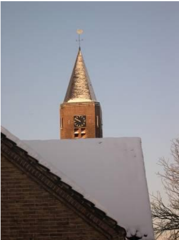
De opgeknapte toren van de Wilhelminakerk in de sneeuw