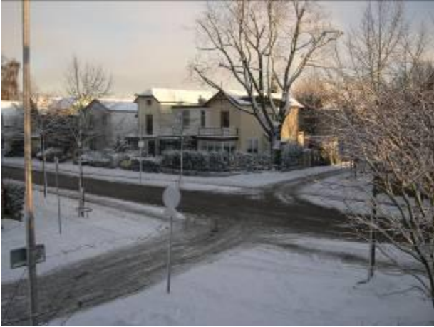
Sneeuw: prachtig, maar ook veel ongemak

We hebben onze grote waardering uitgesproken voor de grote inzet bij de gladheidbestrijding. Door alle sneeuw en ijs kreeg ook wijkbeheer te maken met schaarste van strooizout.